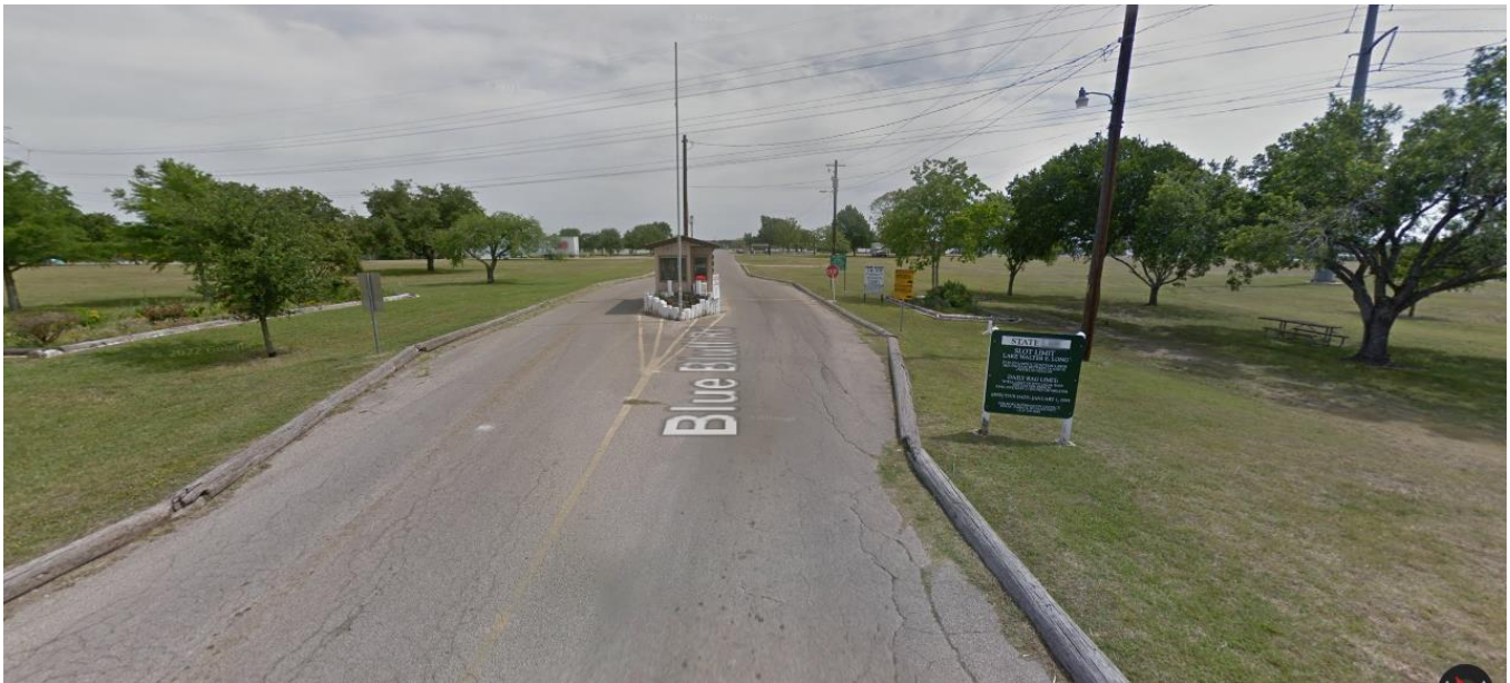
(En la foto: entrada al Parque metropolitano Walter E. Long)

El lugar definitivo de la obra de arte será determinado en colaboración entre el artista seleccionado, personal de la Ciudad y la comunidad.